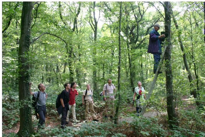
Excursie Rimburgerbos vleermuisnestkasten

van de lezingen en excursies waren zeer gevarieerd: meervleermuizen, diersporen, edelherten en vleermuisnestkasten in het Rimburgerbos. Het geplande zoogdierenkamp begin oktober is door te weinig aanmeldingen niet doorgegaan. Wel zijn er dat weekend in de omgeving ten zuidwesten van Weert met life-traps muizen gevangen. Tijdens zes braakbalpluisavonden is door een min of meer vaste groep vrijwilligers weer stevig geplozen.