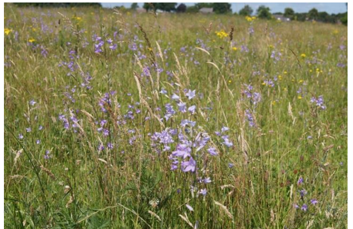
Slangenkruid op de Groote Heide / Rapunzelklokje massaal bij monding Molenbeek