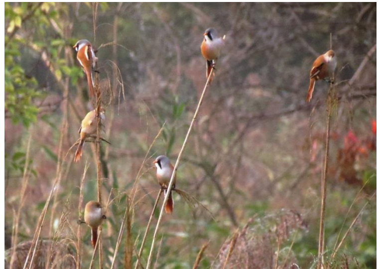
Baardmannetjes bij de Oostvaardersplassen, altijd weer een feest.