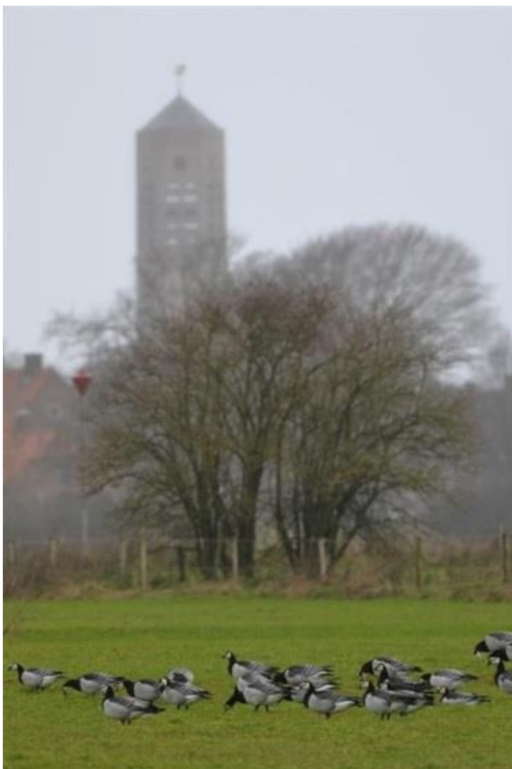
langs de Maas.

Ook de wintervogelstand is veranderd de afgelopen 40 jaar. De hoofdtrends zijn natuurlijk hetzelfde als bij broedvogels. Vogels van agrarisch landschap zijn veelal afgenomen of verdwenen. Zo is de ringmus vrijwel verdwenen en de patrijs sterk afgenomen. Dat roeken en bonte kraaien niet meer voorkomen heeft waarschijnlijk met de klimaatverandering te maken. Ze kunnen noordelijker overwinteren. Voor de watervogels geldt over het algemeen een vooruitgang. Vooral ganzen zijn er nu veel, terwijl we daar in de jaren '70 voor naar de Grote Peel of verder moesten. Aalscholvers en grote zilverreigers waren hier nog onbekend.