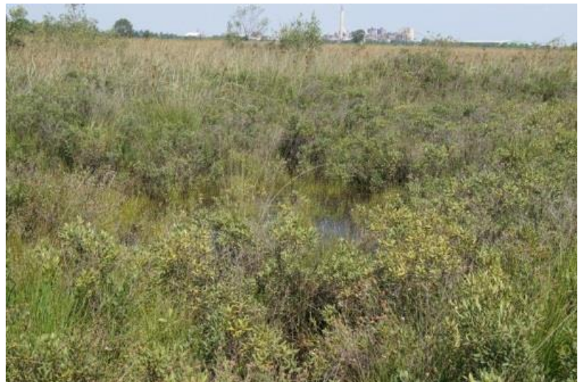
Ringselven-zuid met gagelmoeras, galigaanmoeras en zinkfabriek

Rechts : Taurossen, oerossen in ontwikkeling op de Boshoverheide