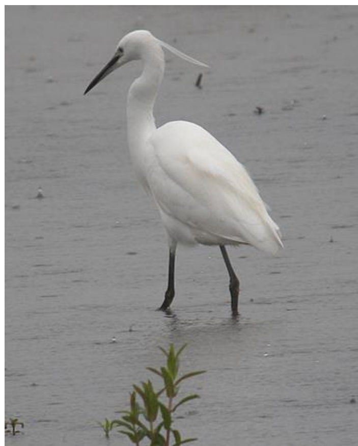
Boven : Kleine Zilverreiger in de Broekhuizerweerd. Grote zilverreigers zijn nu vrij algemeen, kleine nog zeldzaam. Links : Brandganzen langs de Maas bij Bergen. Nu broedvogel in het Leukermeer en 's winters daar