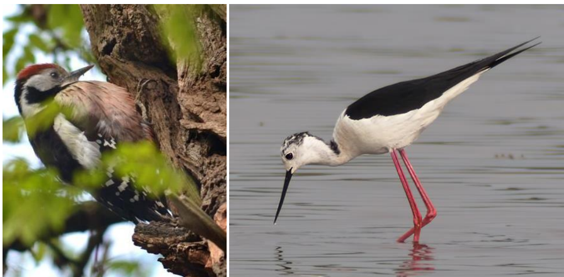
Foto links : Middelste bonte specht broedt weer in oude bossen, hier bij de Bovenste Molen. Foto rechts : Steltkluut broedde in 2013 voor het eerst sinds 1935 weer in Limburg, bij Klein Vink

Ook de wintervogelstand is veranderd de afgelopen 40 jaar. De hoofdtrends zijn natuurlijk hetzelfde als bij broedvogels. Vogels van agrarisch landschap zijn veelal afgenomen of verdwenen. Zo is de ringmus vrijwel verdwenen en de patrijs sterk afgenomen. Dat roeken en bonte kraaien niet meer voorkomen heeft waarschijnlijk met de klimaatverandering te maken. Ze kunnen noordelijker overwinteren. Voor de watervogels geldt over het algemeen een vooruitgang. Vooral ganzen zijn er nu veel, terwijl we daar in de jaren '70 voor naar de Grote Peel of verder moesten. Aalscholvers en grote zilverreigers waren hier nog onbekend.